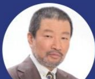
きょうと健康大使